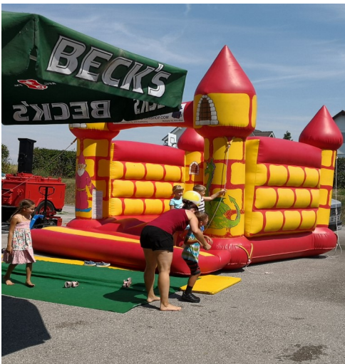
Auch die Kinder hatten ihren Spaß.