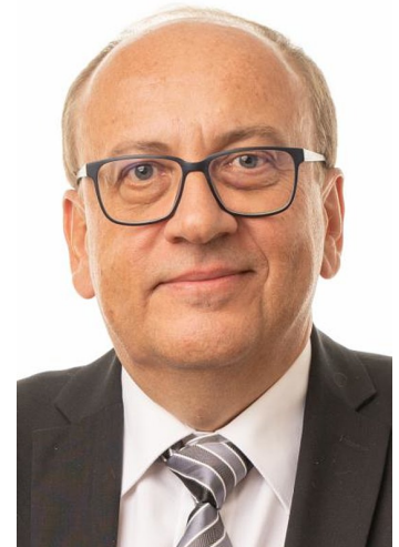
Autor: GR Reinhard Hirsch

Seitens des Gemeinderates wurden aber im Gegenzug einstimmig beschlossen, innerhalb einer Arbeitsgruppe Möglichkeiten für die Unterstützung von sozial schwachen und bedürftigen Einwohnerinnen und Einwohnern der Gemeinde zu prüfen und dem Gemeinderat zu berichten.